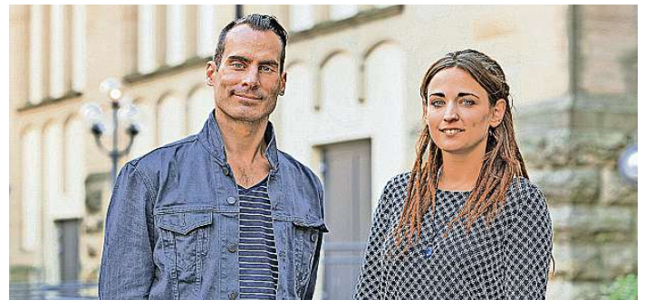
„Blickwinkel“ – die Ausstellung mit Fotografien von Sebastian Seibel und Texten von Stefanie Neuhäuser wird im Kulturhaus Osterfeld eröffnet.